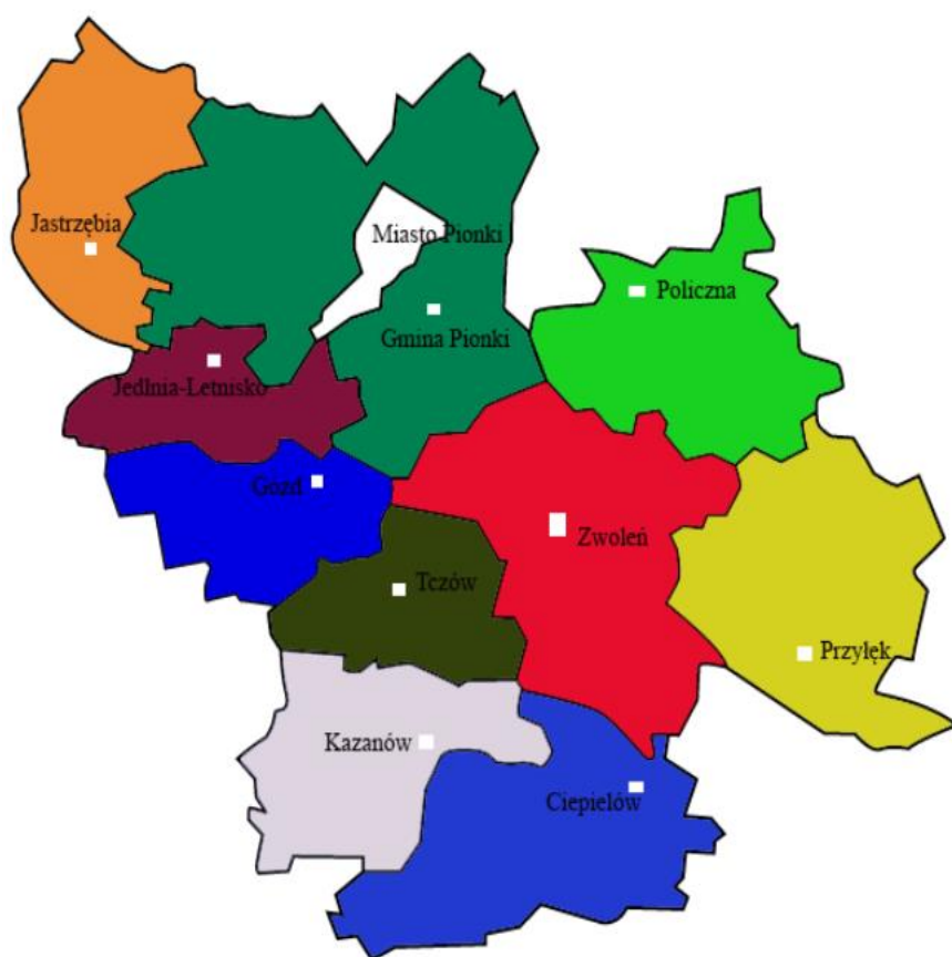
Mapa 1 Mapa obszaru LSR Stowarzyszenia „Dziedzictwo i Rozwój”