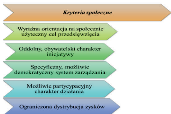
Schemat. Najczęściej określone kryteria społeczne oraz kryteria ekonomiczne.